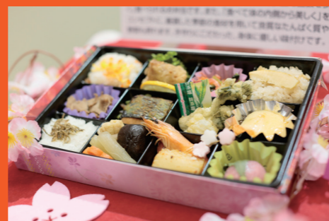
◆審査委員長特別賞◆ 「春うらら～雅弁当～」 株式会社はたなか