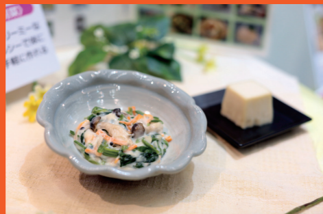
◆お惣菜部門 最優秀賞◆ 「胡麻豆腐の白和え」 株式会社廣八堂