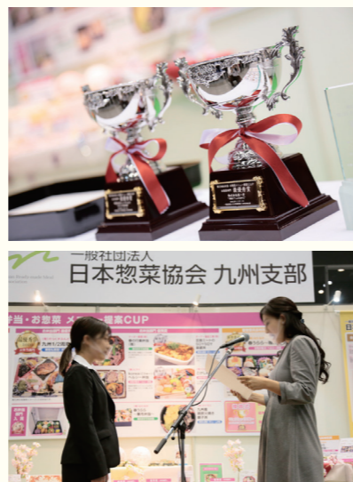
画像はイメージとなります