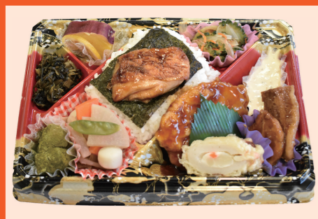
◆お弁当部門 最優秀賞◆ 「九州 1/2 周南部編」 有限会社だっくすふんと